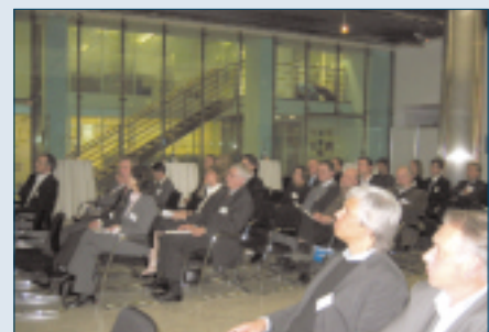
Publikum während der Vorträge