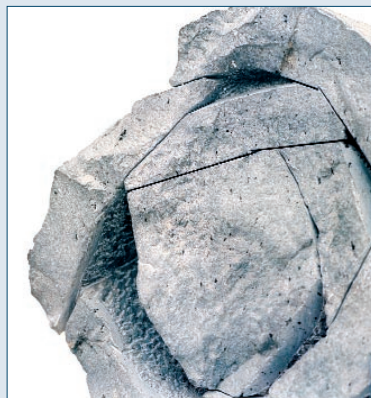
Die „Kleine Rose“ hat ihren Platz im Empfangsbereich der Kanzleiräume von HEISSE KURSAWE gefunden