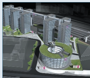
Telekom Center in München

Die neuen Partner sind aktuell bzw. waren in der Vergangenheit beratend tätig bei dem Neubau des Bürostandortes der Infineon Technologies AG in Unterbiberg, dem Hochhausprojekt Uptown München in Moosach, der neuen Firmenzentrale Bosch Siemens Hausgeräte in Neuperlach, dem Telekom Center in München, dem Forschungsreaktor Garching, dem Umbau des Düsseldorfer Flughafens, der vertraglichen Konzeption